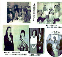
▲16.11月 青森県高校と島根県高校の学生との輪投げ体験 結のたぬき作り(宮中中は島根県ロータリークラブが青森 県と10代高校生ロータリークラブより提供し)