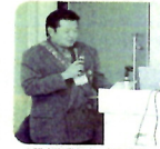
▲記念事業紹介 総務委員会