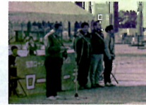
ロータリーデーに設定