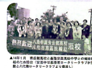
▲16.1月 青森縣高校と島根県高校の学生との輪投げ体験 結のたぬき作り(宮中中は島根県ロータリークラブが青森 県と10代高校生ロータリークラブより提供し)