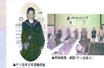
▲7.1 高千穂高等学校 エルクワイルドリン