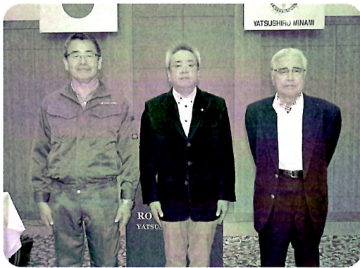
結婚記念の会員 (11/5 例会)