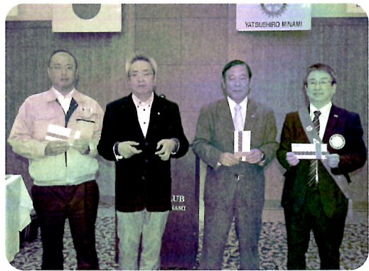
誕生日の会員 (11/5 例会)