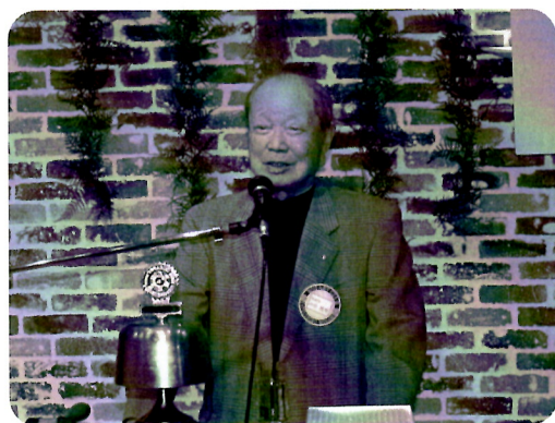
中川会員による乾杯