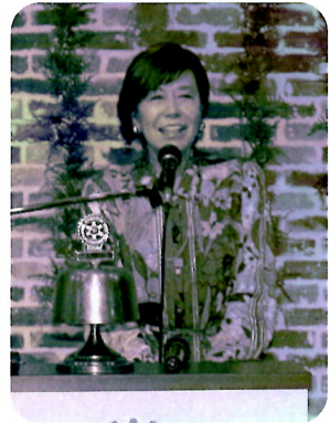
湊上副会長 閉会の挨拶