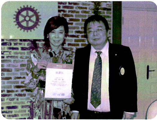
カウンセラー 湊上会員へ 感謝状