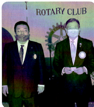
連続45年出席 緒方会員