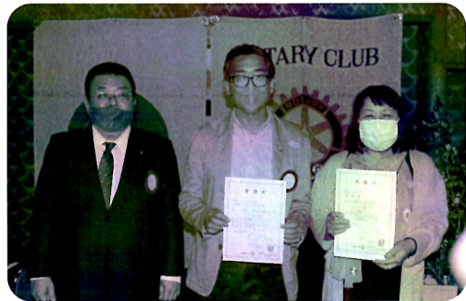
委嘱状伝達 (市野会員代理)