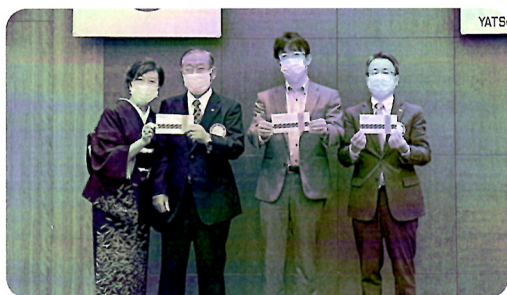
11月誕生祝の皆さん