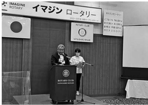
竹永会頭ごあいさつ