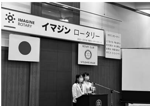
やっしろ国際協会について