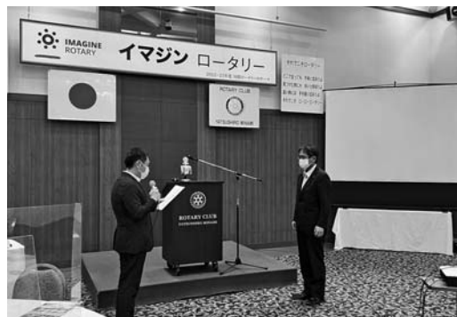
地区委員委嘱状 市野会員